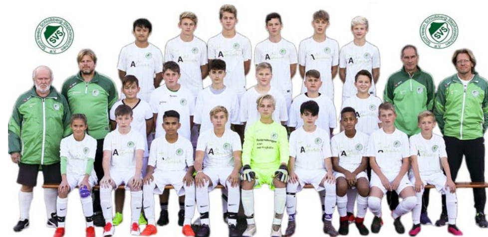
SV SCHLOSSBERG STEPHANSKIRCHEN C - JUNIOREN

ung (unsere Hauptkonkurrenten gegen den Abstieg haben wir an den ersten 4 Spieltagen) und die Disziplin hoch zu halten, dann werden wir unser Saisonziel Nichtabstieg erreichen.