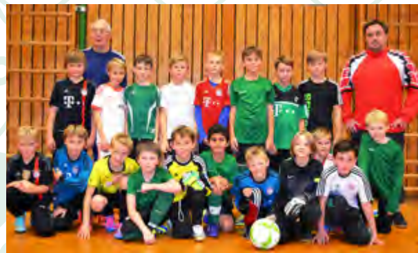
E1+E2 - Jugend