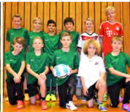
D2 - Jugend