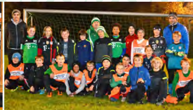
E3+E4 - Jugend