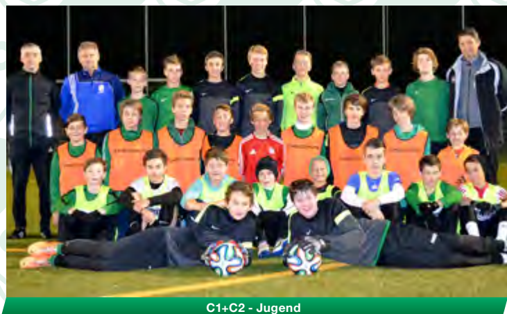
C1+C2 - Jugend