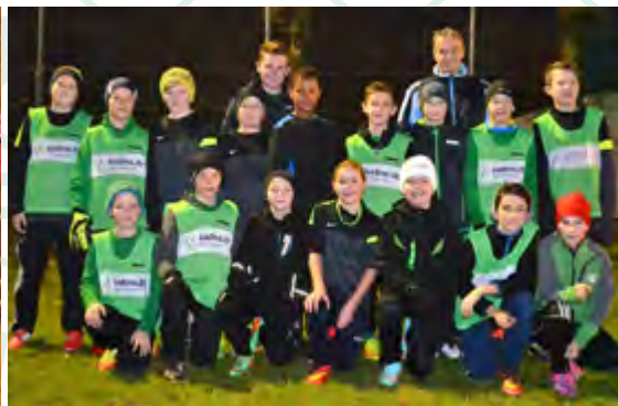
D3 - Jugend