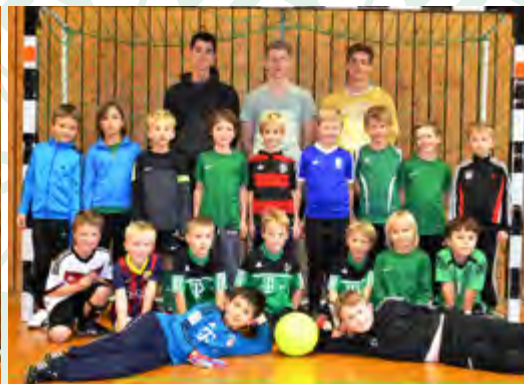
F1+F2 - Jugend