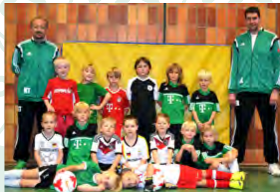
G - Jugend