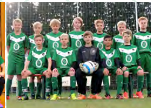
D1 - Jugend