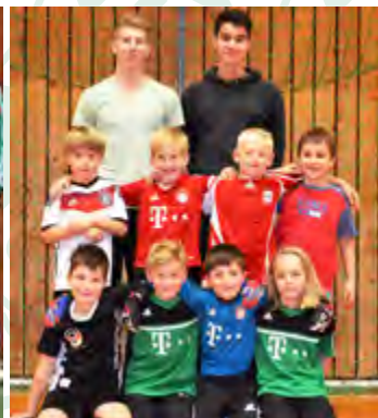
F3 - Jugend