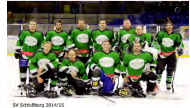
SV Schloßberg 2014/15

Die Eishockeyabteilung des SV Schloßberg-Stephanskirchen spielte die abgelaufene Saison 2013/14 wieder in der Rosenheimer Hobbyliga. Diese Liga besteht bereits seit 35 Jahren und erlebt zur Zeit wieder einen kleinen Aufschwung. In den letzten Jahren schlossen sich immer zwei neue Mannschaften dem Spielbetrieb an. Wir spielten letzte Saison in der unteren Spielklasse, da wir mit unserer Spielgemeinschaft einen Neuanfang mit jungen Spielern versuchen wollten. Dieses Experiment war ein großartiger sportlicher Erfolg. Lediglich am letzten Spieltag mussten wir leider unsere einzige Niederlage wegstecken. An diesem Abend spielte der Tabellenletzte (SVS) gegen den Tabellenzweiten. Durch diese Niederlage tauschten die Mannschaften dann die Plätze, so dass das Team „Eisbeisser Rechtmehring“ Meister wurde und in die obere Spielgruppe aufstieg. Der Start in die neue Saison verlief etwas holprig, da es bei unserem Spielpartner einige Probleme gab. Aus diesem Grund mussten wir uns dazu entschließen, die neue Saison 2014/15 wieder als eigenständige Mannschaft zu spielen und unser Team mit einzelnen Spielern unseres Partners zu verstärken. Die laufende Saison ist zwar noch jung, aber