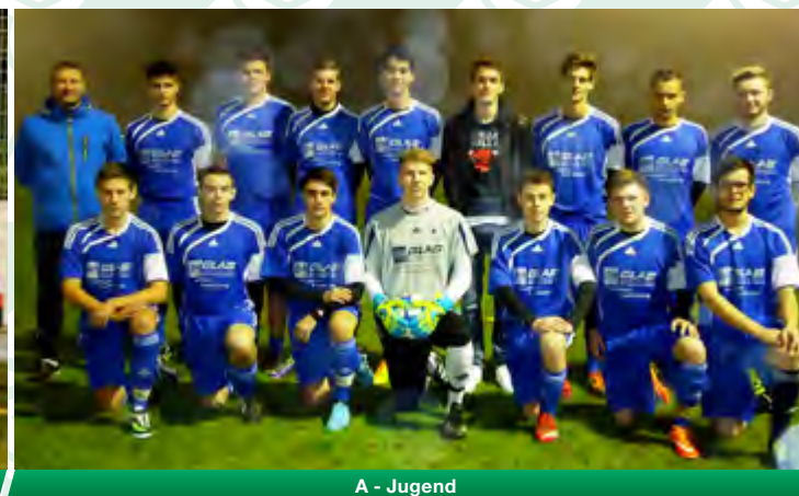
A - Jugend