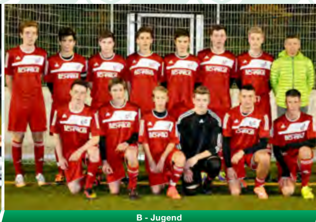
B - Jugend