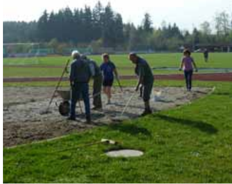
Arbeitseinsatz Anfang April auf dem Sportgelände

wir leben in einer beschleunigten Zeit, ein Termin jagt den anderen und bis man sich umsieht, sind schon wieder 12 Monate vorbei. So raste auch das Jahr 2011 dahin, und es war ein gutes Jahr für unseren Sportverein. In dem vorliegenden Heft berichten die Abteilungsleiterinnen und -leiter über die Ereignisse und sportlichen Wettkämpfe in ihren Sparten. In meinem Bericht gehe ich auf besondere Ereignisse und Projekte aus Sicht des Hauptvereines ein. Die Mitgliederzahl blieb mit 1552 Personen (Stand: 29.11.2011) im Vergleich zum Vorjahr konstant (1550 am 27.11.2010). Einen Überblick zur Verteilung in den Abteilungen gibt folgende Tabelle.