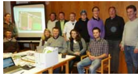
Das dreizehn-köpfige Projektteam Kunstrasenplatz

Gemeinde gut voran. Seit der Gemeinderatssitzung am 28. Juni, als alle anwesenden Mitglieder des Rates dem Investitionszuschuss für den Bau zustimmten, stand der Finanzierungsplan und konnte somit der BLSV-Förderantrag um einen staatlichen Zuschuss ausgearbeitet und eingereicht werden. Das dreizehnköpfige Projektteam arbeitet in drei Gruppen: 1. BLSV-Förderung, Zahlungsfluss und Kostenüberwachung, 2. Bauliche Konzeptionierung und Durchführung, 3. Finanzierung durch Sponsoring.