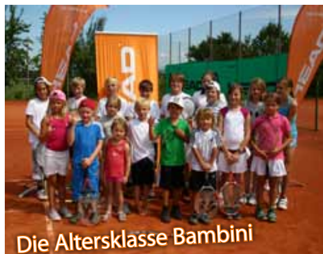
Die Altersklasse Bambini