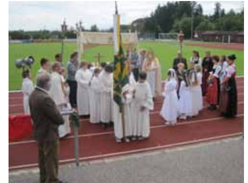
Fronleichnamsprozession auf dem Sportgelände

Bei der diesjährigen Fronleichnamsprozession am 23. Juni zogen viele einheimische Gläubige zu unserem Sportgelände, wo auf der Tartanbahn ein schön geschmückter Altar als erste Station aufgebaut war. Die Damen der Jungbauernschaft legten in den Morgenstunden vor dem Altar einen bunten Blumentepich. Die Lesung und die vier altersspezifischen Fürbitten (Kind, Jugendliche, Erwachsene und Rentner) wurden von Vereinsmitgliedern vorgetragen. Obwohl am Vorabend äußerst ungünstige Wettervorhersagen für den kommenden Feiertag im Internet zu lesen waren (Regenwahrscheinlichkeit 96%), blieb der Regen aus, es ließ sich sogar die Sonne blicken. Erstaunlich, was 4% Wahrscheinlichkeit ausmachen können.