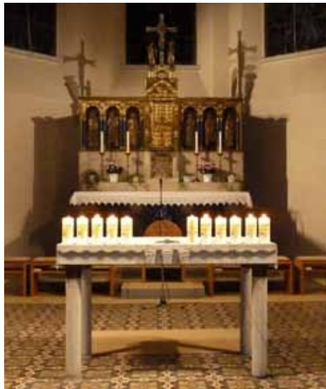
Alle Vereinskirchen brannten auf dem Schloßberger Altar

Es heißt, nichts sei so beständig wie der Wandel. Am 19. November feierten wir unseren