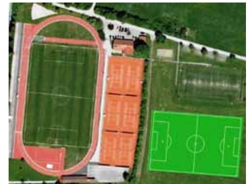
Lage des neuen Kunstrasenplatzes

Wie im OVB bereits ausführlich berichtet, geht es mit dem Kunstrasenplatz in unserer