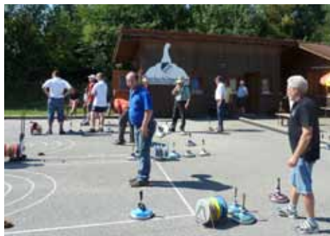
Hochbetrieb auf den Asphaltbahnen der Stockschützen

Zur Sommerpunktrunde am 14. und 21.05.11 wurde unsere Mannschaft in der C-Klasse mit 23:5 Punkten Kreismeister und stieg in die B-Klasse auf. Gratulation nochmals an die Spieler. Wir wurden auch von anderen Vereinen zu ihren Turnieren eingeladen, z.B. Prutting, Söchtenau,