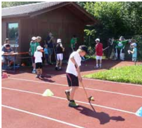
Station der Eishockeyabteilung beim Trudl-Steinhart Fest

Auch dieses Jahr war die Abteilung Eishockey beim Trudl Steinhart Fest wieder mit einem Stand vertreten und war Teil des Ferienprogrammbeitrages des Vereins. Leider ist es der Abteilung aus Versicherungsgründen und auch zeitlicher Probleme nicht möglich eine Jugendmannschaft zu führen.