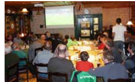
Fußball-Abend in der Sportgaststätte