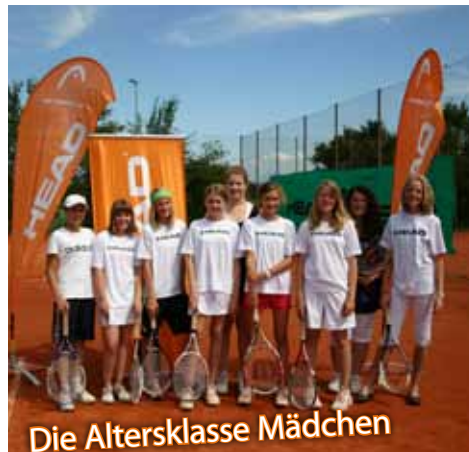
Die Altersklasse Mädchen