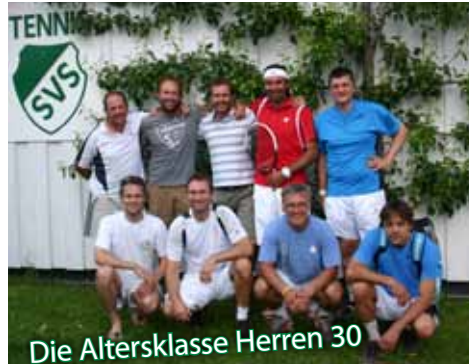
Die Altersklasse Herren 30