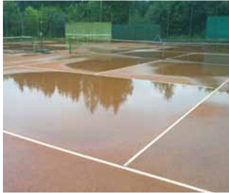
Grundsanierung der Tennisplätze dringend notwendig

Wenn das Kunstrasenprojekt abgeschlossen sein wird, geht es mit der nächsten Baustelle weiter. Die Tennissandplätze sind aufgrund der immer wieder aufgeschobenen Grundsanierung nun in einem extrem schlechten Zustand. Das Oberflächenwasser steht nach