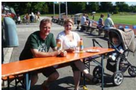
Station der Eisstockabteilung beim Trudl-Steinhart Fest

Dank der regen Mithilfe der Abteilungsmitglieder konnten wir zeitgleich am 16.07.11 beim Trudl-Steinhart-Sportfest unser erstes Duo-Turnier am Vormittag und Nachmittag ausrichten. Auch hierbei gilt der Dank der Abteilungsleitung den Helfern und Schützen, ohne die so ein aufwendiges Programm nicht durchgezogen werden kann.