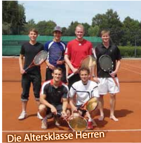
Die Altersklasse Herren