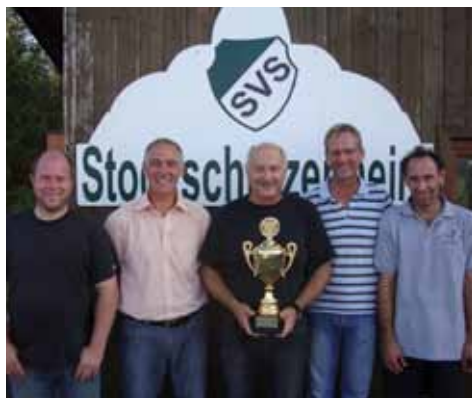
Die Gewinner des Gemeindepokals

Nun naht der Saisonabschluss, den wir auf eigenen Bahnen am 17.09.11 mit dem Gemeindepokal eingeläutet haben. Als Sieger verwies die Mannschaft aus dem Achenfeld die Gegner auf ihre Plätze.