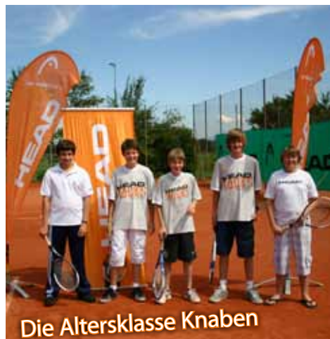
Die Altersklasse Knaben