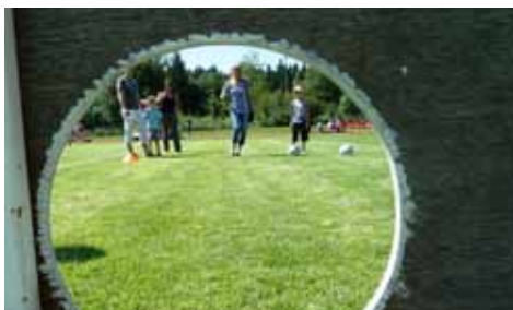
Hinter der Torwand beim Trudi-Steinhart Fest

In diesem Schuljahr gab es bis jetzt ein Freundschaftsspiel, das mit 6:0 gewonnen wurde und einige erfolgreiche Teilnahmen an Turnieren, sowohl drinnen als auch draußen. (Jakob Scheuring)