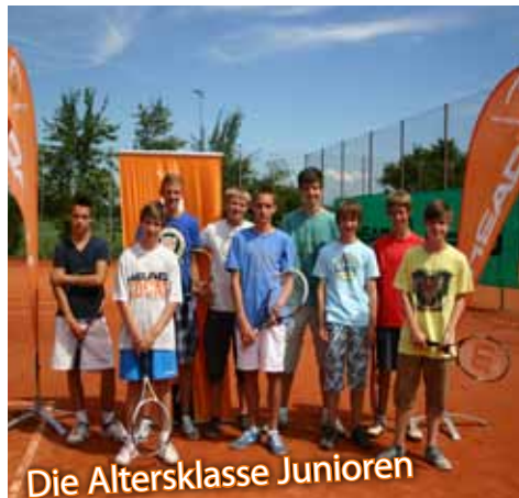
Die Altersklasse Junioren