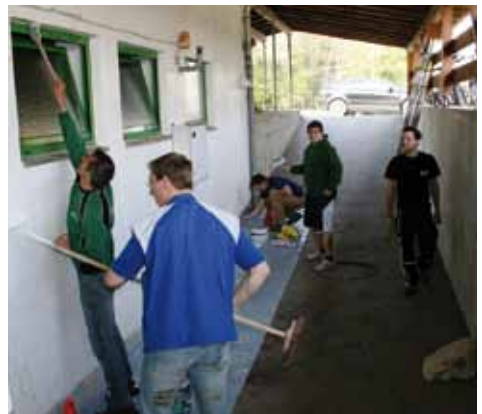
Viele fleißige Hände halfen beim Arbeitseinsatz mit.