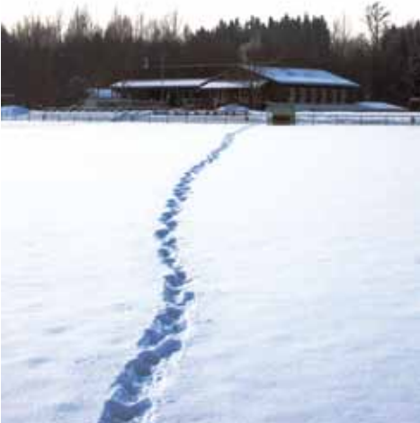
Eingeschnittenes Vereinsgelände im Februar 2010

Turnen für Kinder, Skikurse, Gymnastikstunden, Leichtathletik und Sportabzeichen, Fußball (10 Nachwuchsmannschaften!), Walking und vieles mehr. Dafür braucht man Platz. Das räumliche Ressourcenproblem hat sich mit der Wandlung der Schule in Stephanskirchen in eine offene Ganztageschule mit der entsprechenden Nachmittagsbetreuung (Hallenzeiten wurden für den Verein reduziert) und dem starken Zulauf in der Abteilung Fußball verschärft. Das Projekt Kunstrasenplatz, das in 2009 aufgrund der finanziellen Situation zugunsten dringenderer Anliegen in der Gemeinde im Haushalt zurückgestellt wurde, wird in 2011 nach der deutlichen Erholung in den Gewerbesteuererinnahmen wieder aufgenommen.