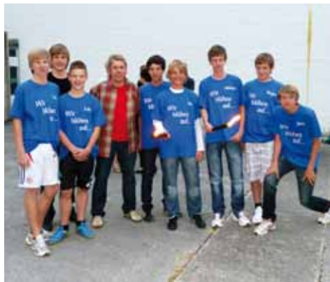
Die jungen Sportler erliefen beim Sponsorenlauf einen beachtlichen Betrag