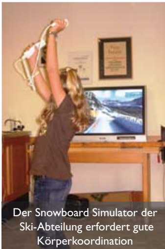
Der Snowboard Simulator der Ski-Abteilung erfordert gute Körperkoordination