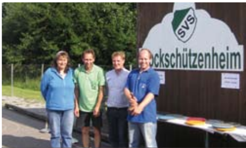
Kompetente Betreuung an der Stockschützenstation