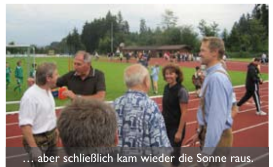
... aber schließlich kam wieder die Sonne raus.