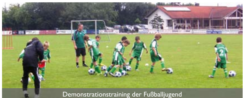
Demonstrationstraining der Fußballjugend