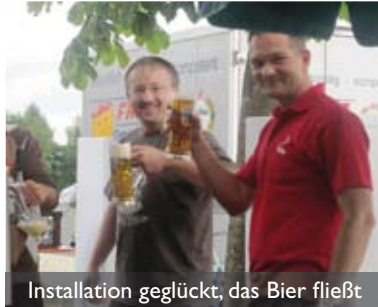
Installation geglückt, das Bier fließt