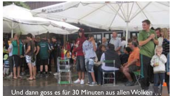
Und dann goss es für 30 Minuten aus allen Wolken ...