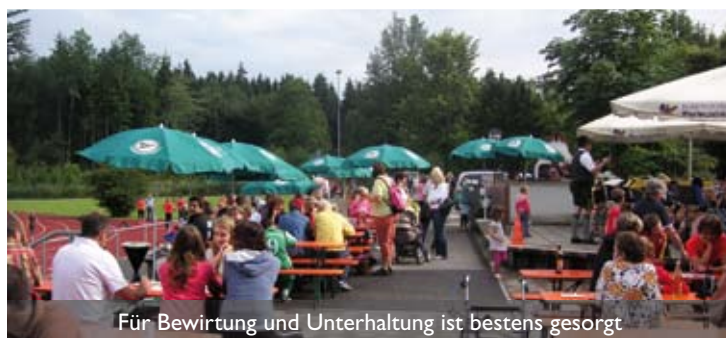
Für Bewirtung und Unterhaltung ist bestens gesorgt