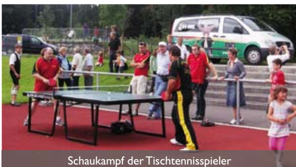
Schaukampf der Tischtennispieler