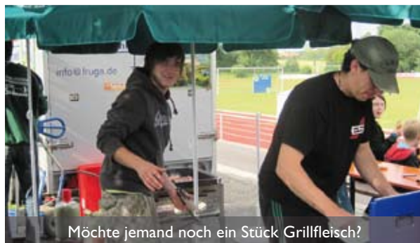
Möchte jemand noch ein Stück Grillfleisch?