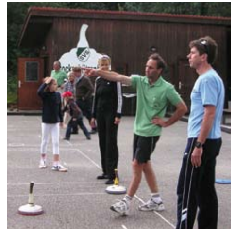
Theorie und Praxis an der Stockschützen-Station