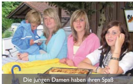
Die jungen Damen haben ihren Spaß