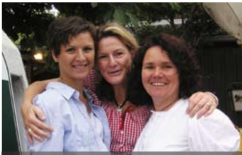
Die drei fröhlichen Damen beim Kuchenverkauf