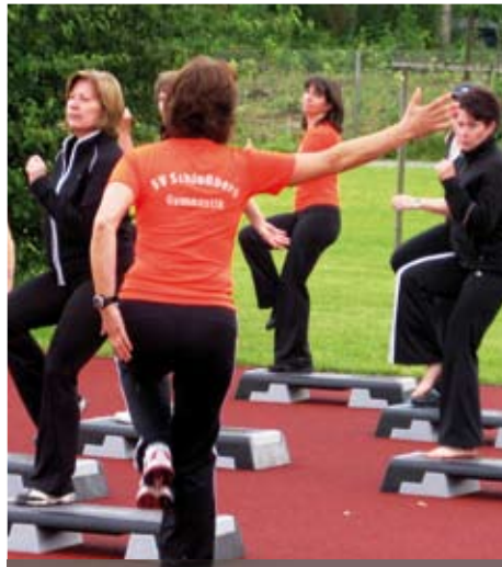
Vorführung verschiedener Gymnastik-Stundenbilder