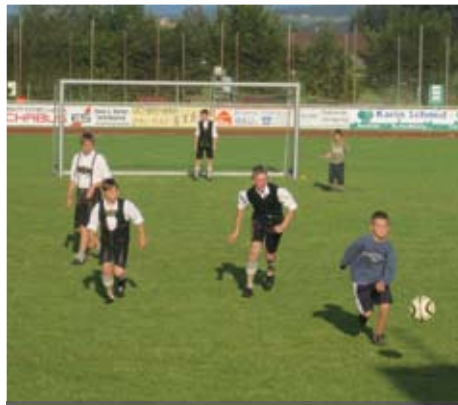
In den Pausen spielen die jungen Musikanten Fußball