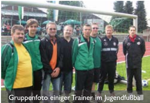
Gruppenfoto einiger Trainer im Jugendfußball